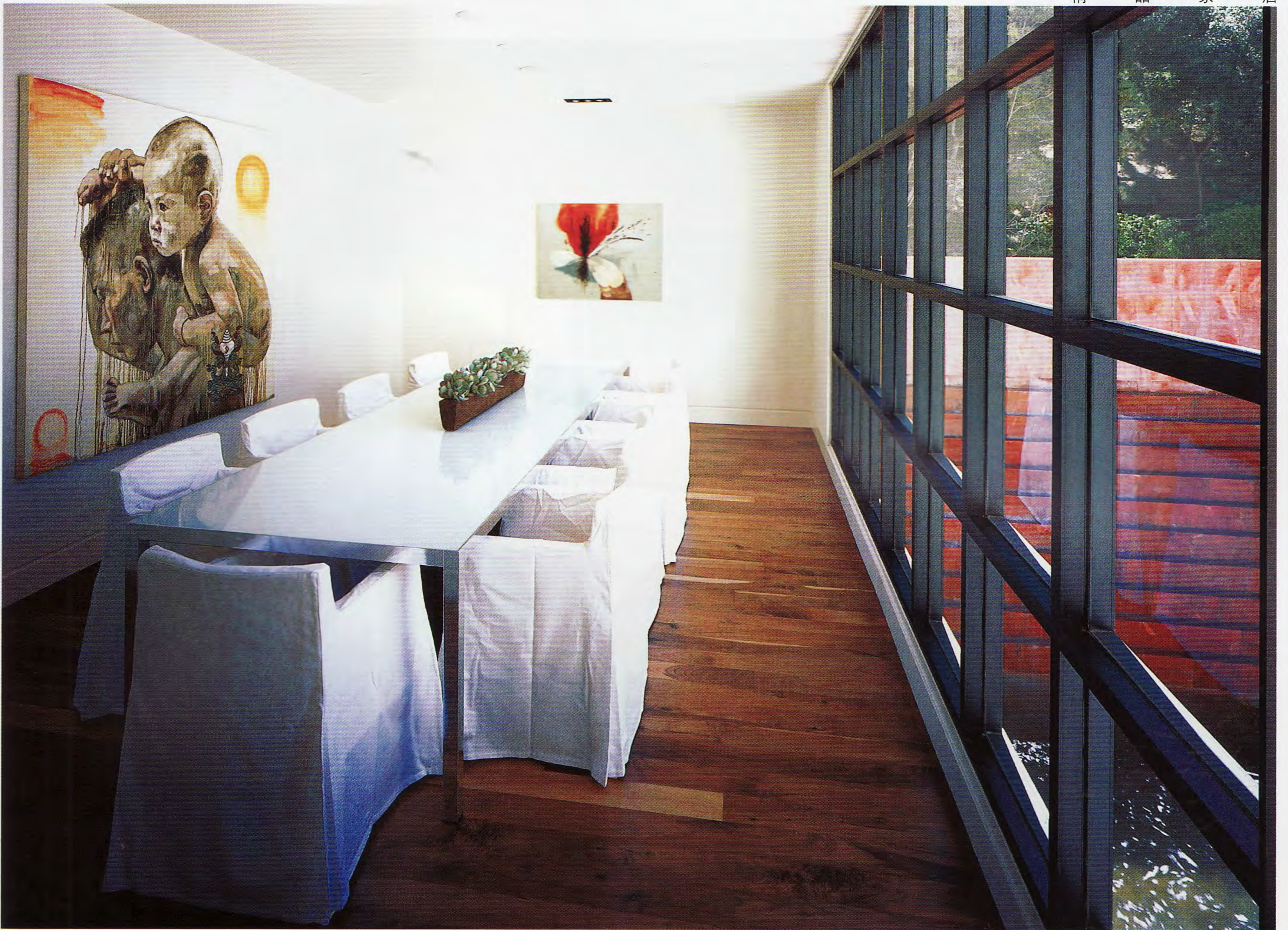
(左上) 房间与房间之间处于开放式状态，流畅自然。