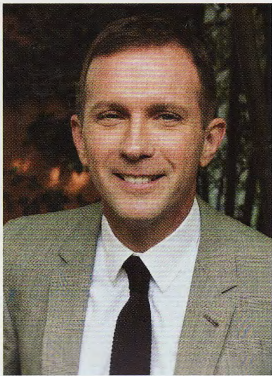
美国设计师 Tim Campbell