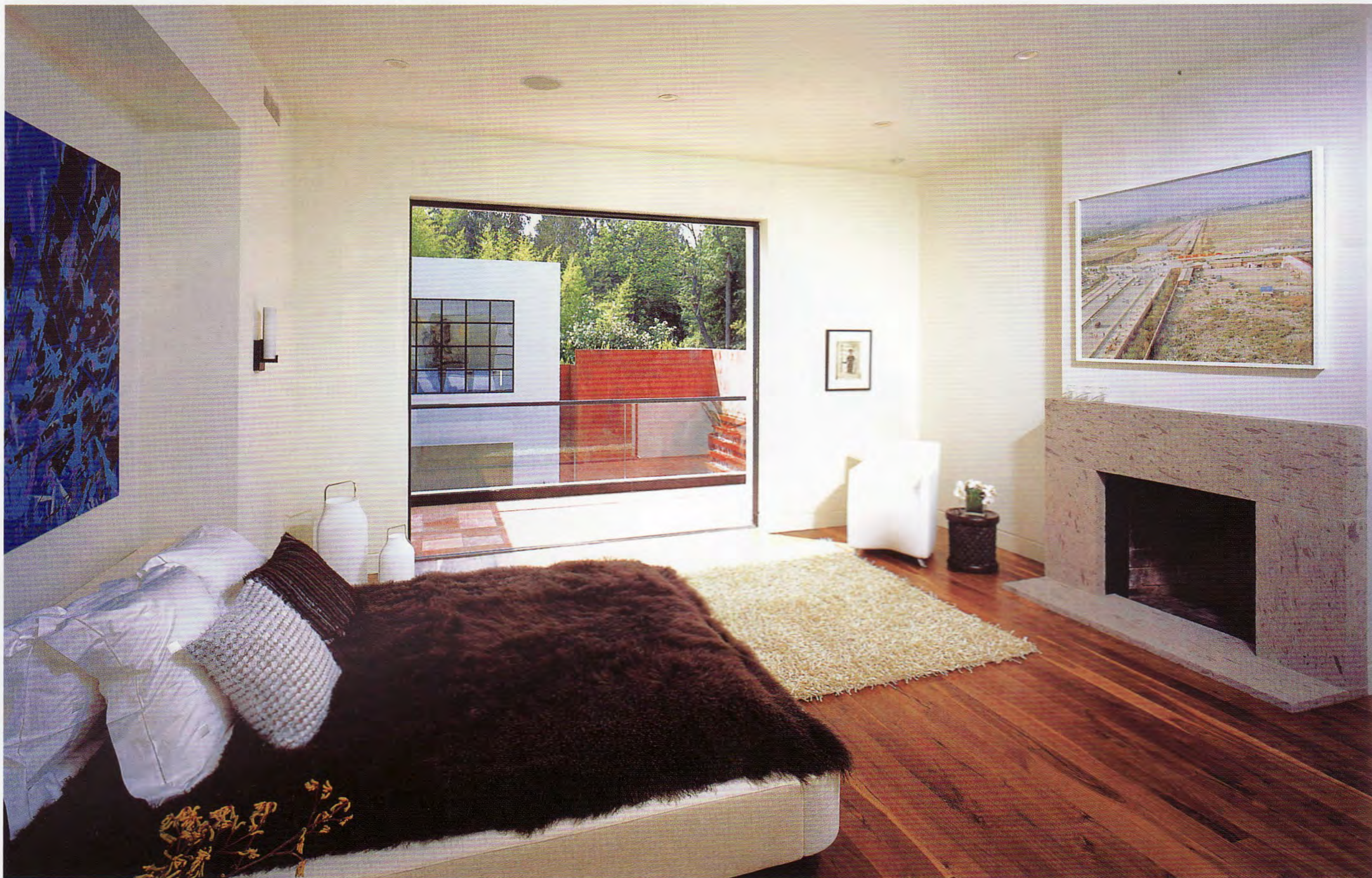
(上) 卧室属于两层楼的副楼，开阔的玻璃窗让空间更明亮。